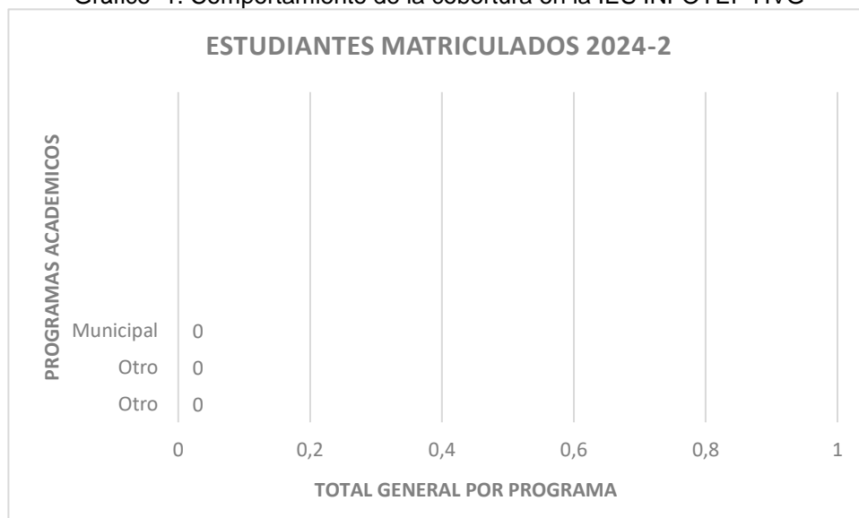
Gráfico 2. Distribución de estudiantes por programas académicos periodo 2024-2